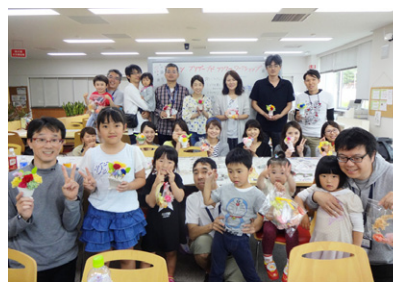
母の日「リガ」ブド「フワ」ワークショップ