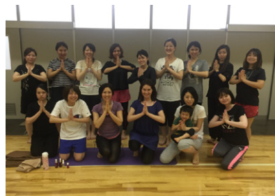
スポーツ交流会（ヨガ）