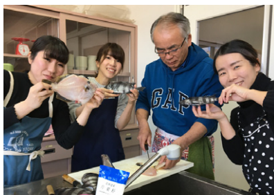
OKAs キッチン（男性従業員による料理教室）