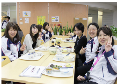
シャッフルランチ会