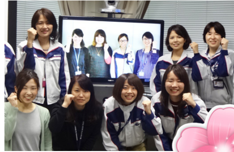
▲愛知とTV会議を繋いでの発足式

「ジョカツ」とは、当社で2016年4月に発足した「女性活躍推進ワーキング」の愛称です。女性のためだけに活動しているの？と思われがちですが、全従業員がイキイキと働き続けられる会社を目指して女性11名で活動を行っています。